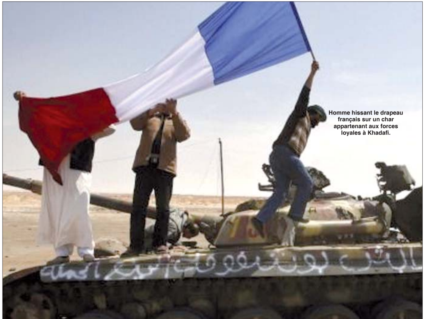
Homme hissant le drapeau français sur un char appartenant aux forces loyales à Kadhafi.

d'Orsay, «on retrouve la politique étrangère que la France a appliquée au fil des présidences successives». Le réseau diplomatique, l'un des plus vastes au monde, cherche alors à rattraper son retard. A la traîne sur tous les dossiers maghrébins, c'est avec la Libye que Paris parvient à retrouver sa stature. De nouveau, «la communauté internationale attend la voix de la France», se félicite le porte-parole du Quai d'Orsay, Bernard Valero. En première ligne, longtemps avant que des soldats tricolores ne se déploient, c'est en effet la diplomatie qui effectue le gros du travail.