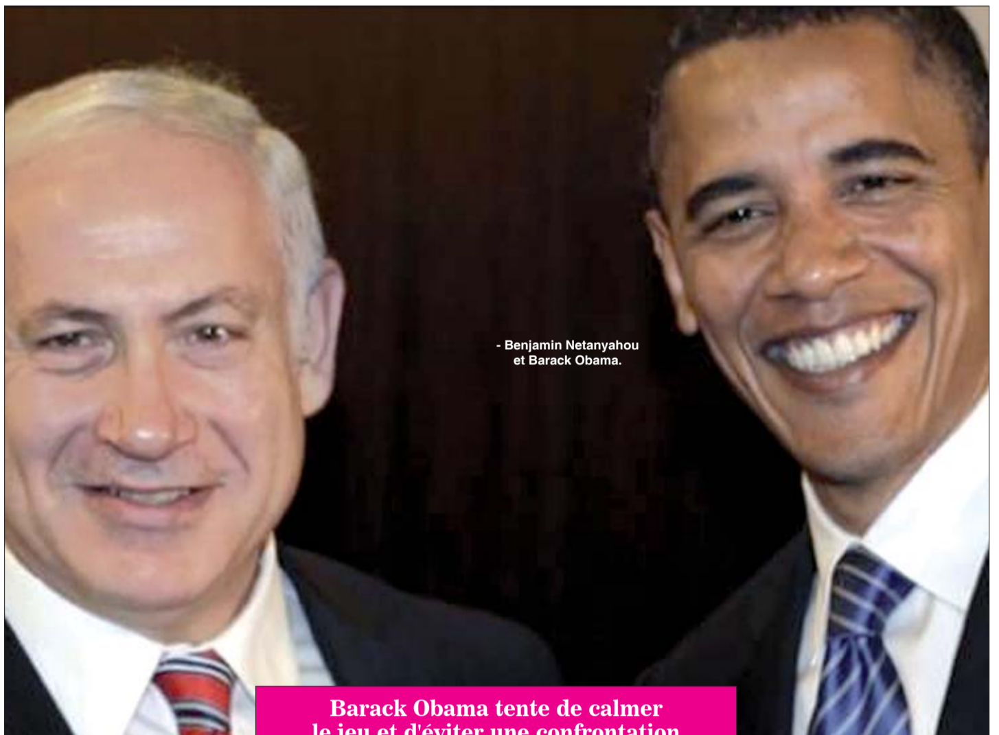
- Benjamin Netanyahu et Barack Obama.